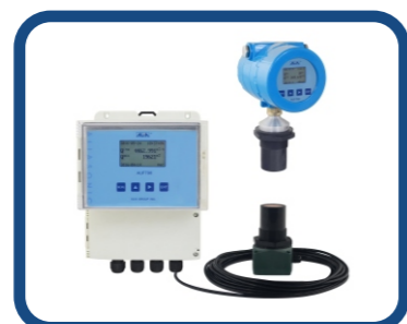
超声波明渠流量计 AUF790