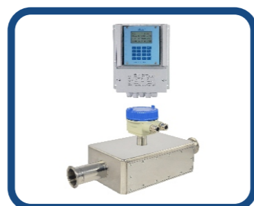
卫生式超声波流量计 AUF770