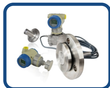
直装式 / 远传式隔离膜片 ADP-D