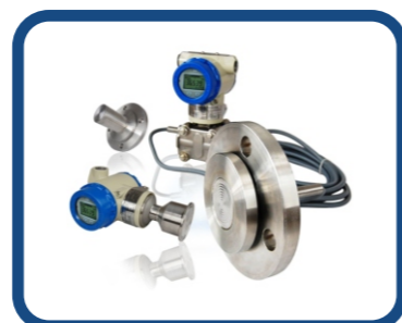
直装式 / 远传式隔离膜片 ADP-D