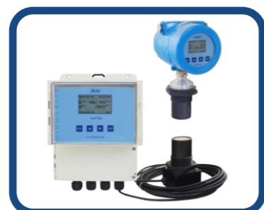
超声波明渠流量计 AUF790